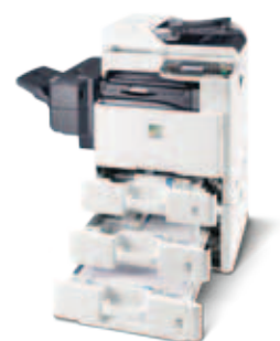
Abbildung mit Optionen.