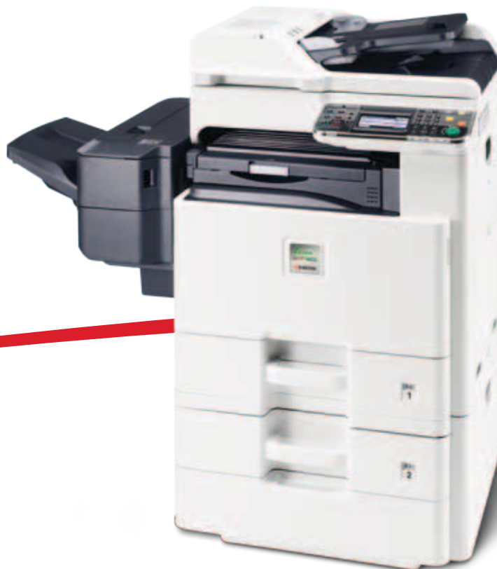
Abbildung mit Optionen.

25 JAHRE Wirtschaftlicher drucken und kopieren.